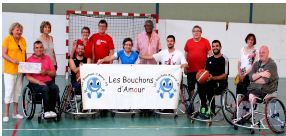
1.500 € pour l'achat d'un fauteuil roulant de basket pour l'association sportive Handisport Orléanais.