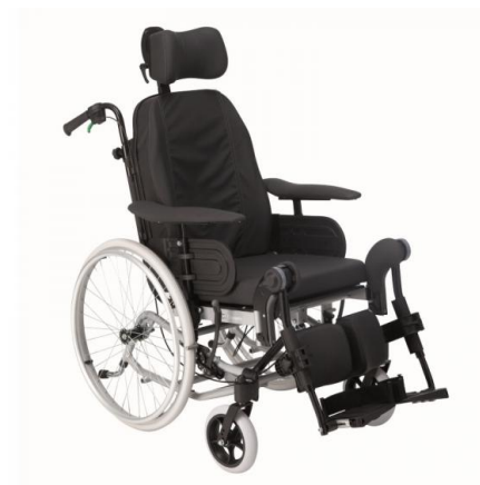
1.000 € pour l'achat du fauteuil roulant de Jean-Luc de Montoire sur le Loir.