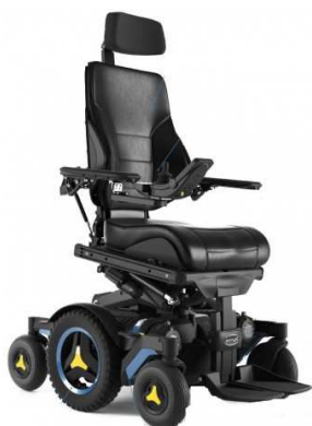
1.500 € pour l'achat du fauteuil roulant de Kévin qui habite Coudroy.