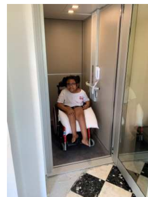
1.500 € pour l'installation d'un ascenseur dans la maison d'habitation d' Angéla de Chécy.