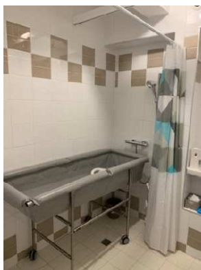
2.000 € pour l'aménagement de la salle de bain de Soraya d'Orléans.