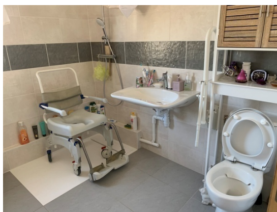
1.000 € pour Khamsay de St Jean de Braye pour l'aménagement de sa salle de bain.