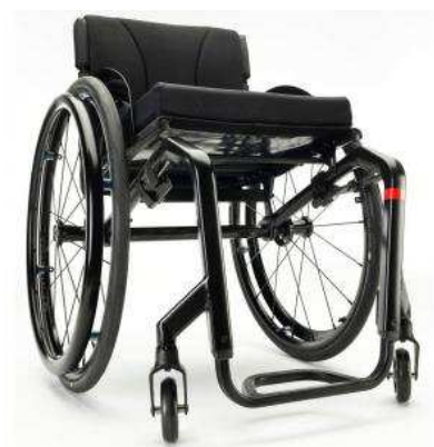
1.000 € pour Abdelmounaim de La Ferté St Aubin pour l'achat de son fauteuil roulant manuel.