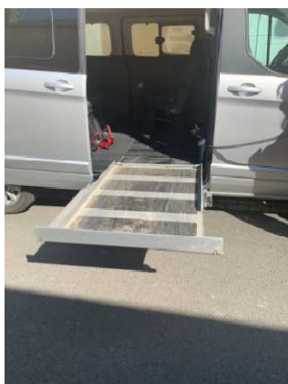
1.000 € pour Chloé de Patay pour l'installation d'une plateforme élévatrice sur son véhicule.