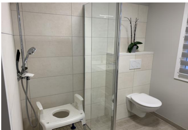
2.000 € pour la création d'une chambre et d'une salle de bain pour Murielle de St Pryvé St Mesmin