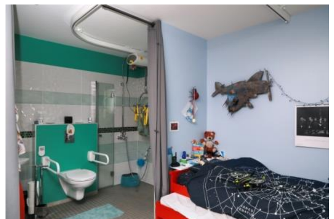
1.000 € pour l'aménagement du logement de Baptiste d'Olivet