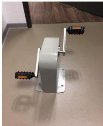
715,20 € pour l'achat d'un cyclo solo fixe au sol pour le Foyer Isambert d'Olivet