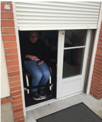
1.774 € pour la motorisation des volets roulants de la maison d' Éric de St Jean de Braye